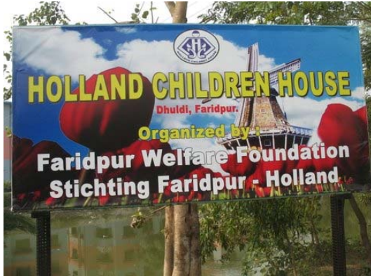
Billboard van HCH langs de weg.