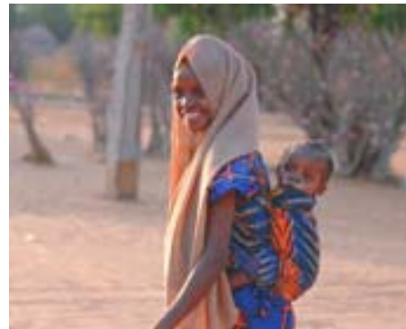
Moeder en kind in Mangu

Stichting Faridpur Wijnserdijk 43 9062 GP Oenkerk Nederland E-mail: cspronk@hetnet.nl Bank rek. 292 662 610