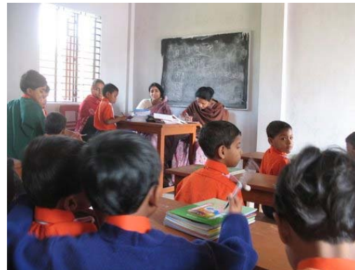
Klaslokaal van school van Holland Children House.

Na 2008 zal aan de hand van de opgedane ervaringen worden besloten of het kindertehuis zal worden uitgebreid met nog een appartementgebouw.