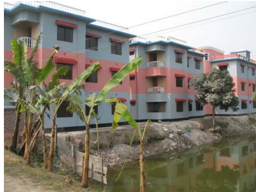
Holland Children House met vijver, vanaf de weg.

In de loop van 2007 werd begonnen met de afrondende fase en completering (fase II). Eind december 2007 waren alle 3 appartementgebouwen helemaal klaar en daarmee was het Holland Children House helemaal volgens plan gerealiseerd. Wat voor 2008 nog resteert is het verbeteren en versterken van de walbeschoeiing met de voorliggende vijver. Zie foto. Aansluitend is begonnen met het uitkiezen en onderbrengen van alleenstaande kinderen tot een totaal van 105 kinderen (status maart 2008).