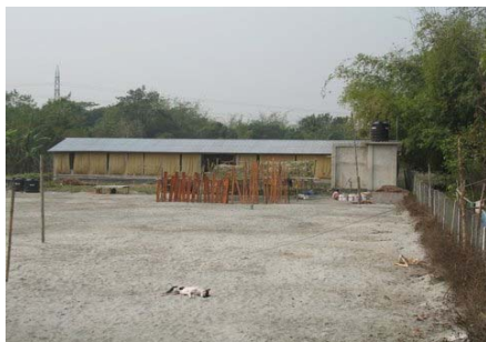
Veeboerderij voor 50 runderen

Medio 2007 is de eerste groep runderen gekocht en aan het eind van 2007 weer verkocht. De netto opbrengst was teleurstellend, wat deels te wijten was aan onervarenheid (goede evenwichtige voeding en goede veterinaire behandeling is een key-issue) en de onverwacht snel gestegen grondstofkosten. Bovendien hebben de sterk gestegen voedselprijzen er voor gezorgd dat vlees niet meer betaalbaar is voor veel gezinnen. In 2008 zal het bedrijf op een bescheiden schaal worden vervolgd.