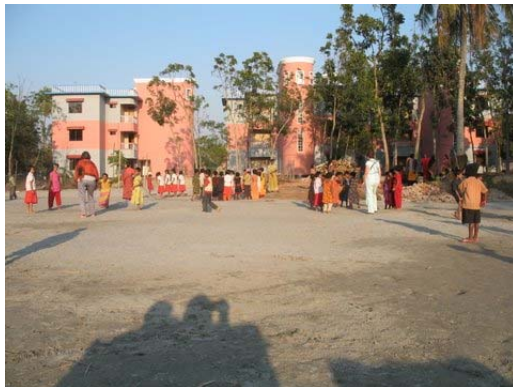
Holland Children House vanaf de achterkant.

In de loop van 2007 werd begonnen met de afrondende fase en completering (fase II). Eind december 2007 waren alle 3 appartementgebouwen helemaal klaar en daarmee was het Holland Children House helemaal volgens plan gerealiseerd. Wat voor 2008 nog resteert is het verbeteren en versterken van de walbeschoeiing met de voorliggende vijver. Zie foto. Aansluitend is begonnen met het uitkiezen en onderbrengen van alleenstaande kinderen tot een totaal van 105 kinderen (status maart 2008).