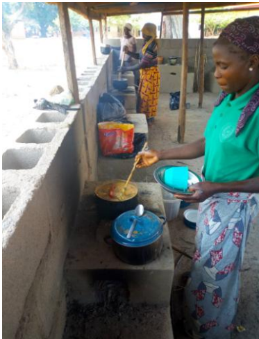
Buitenkeuken met hoge vuurplaten

Voor het brandwonden preventieprogramma hebben we € 3.000,- bijgedragen.